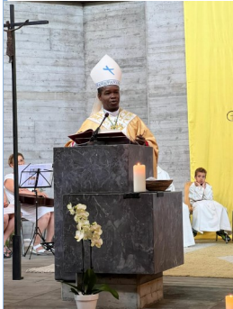
Arzobispo Fortunatus Nwachukwu Representante del Papa ante la Organización Internacional para las Migraciones, las Naciones Unidas y la Organización Mundial del Comercio en Ginebra