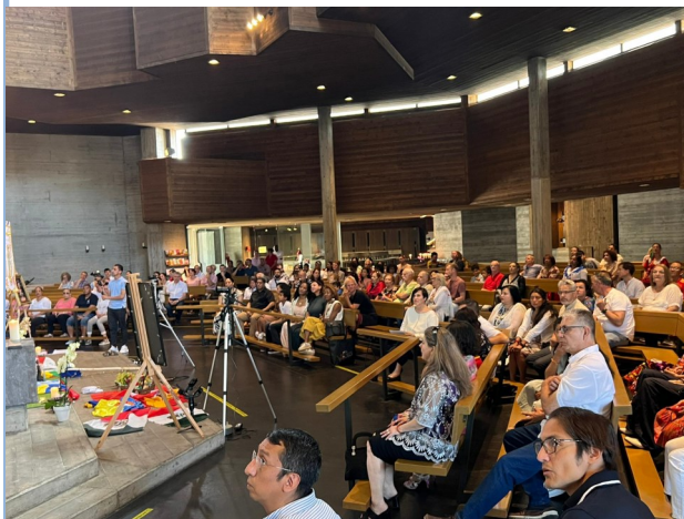
Vista de los asistentes.