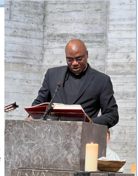
Vicario episcopal de la región de St. Urs, Obispo de Basilea Valentine Koledoye