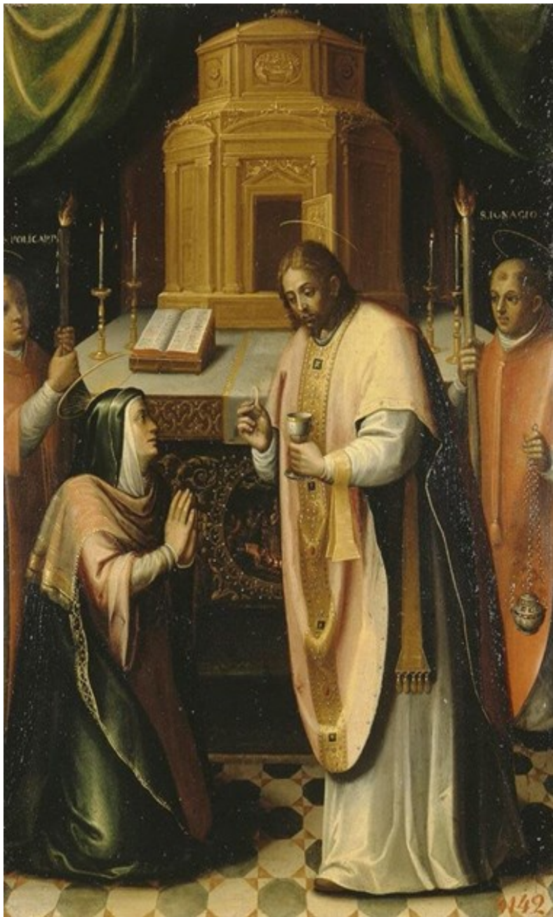
Fuente: Museo el Prado. Jesucristo dándole la comunión a la Virgen (año