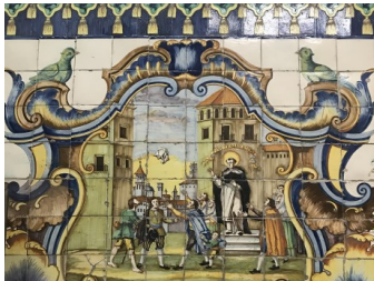
Mosaico Casa natal San Vicente Ferrer, Valencia

Las imágenes que representan a San Vicente Ferrer lo muestran alzando su mano y señalando con su dedo índice, debido a que de acuerdo a las referencias habría realizado varios milagros levantando su dedo hacia el cielo.