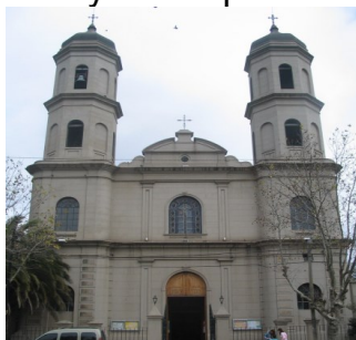
Iglesia de San Vicente Ferrer

El área donde se había establecido el pueblo antiguo y la capilla a orillas de la laguna era inundable, por esto y otras razones en favor de la población, el pueblo se traslada al sur de esta zona, fundándose la actual ciudad y municipio en 1856. La Iglesia