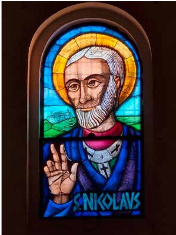
Catedral en Bari (I) El nombre del santo en italiano "San Nicola"